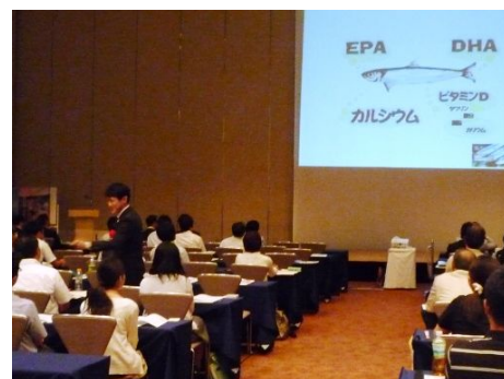
千葉をテーマにした特別模擬授業