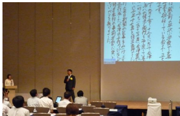
観光・まちづくり教育賞・受賞者の実践発表