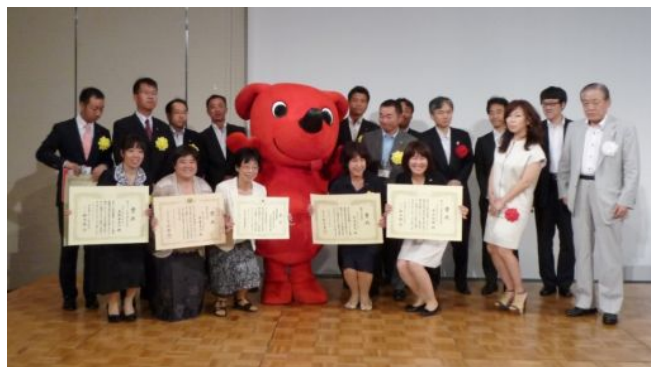
千葉県キャラクター「チーバくん」・受賞者記念撮影