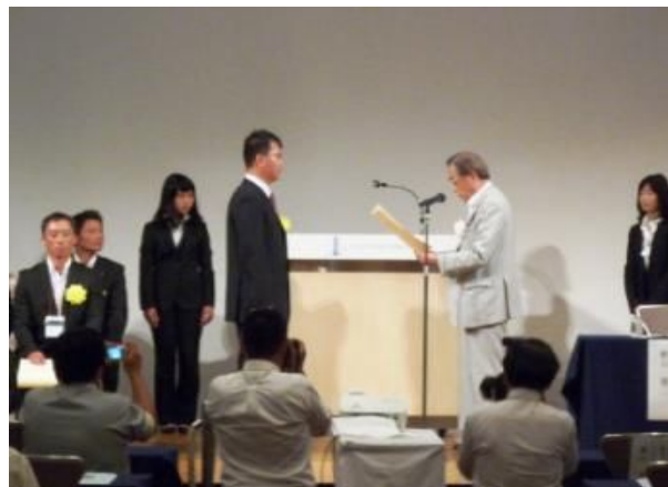
観光・まちづくり教育賞・表彰