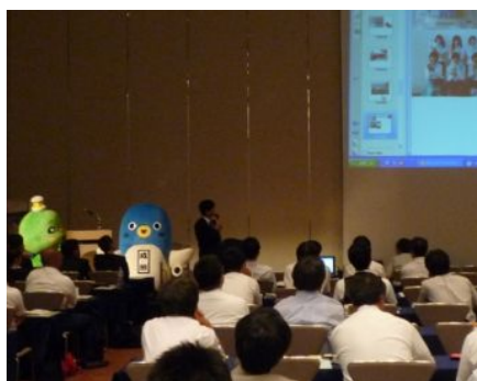
千葉県教師による観光模擬授業