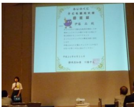
静岡県「子ども観光大使」の発表